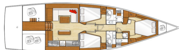
3 cabines - 3 salles d'eau